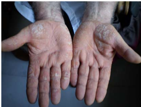
Psoriasis palmo-plantar severa

“Mismos perros inmunológicos con distintos collares”