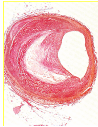
Placa de ateroma

Cuando comenzamos a ver los primeros resultados de la administración de “oHo” en nuestros pacientes renales, ya sabíamos que una de nuestras dianas terapéuticas tenía que ser la Psoriasis. La enfermedad cutánea se asocia a niveles bajos de colesterol bueno (HDL), con el riesgo consiguiente de Enfermedad Cardiovascular.